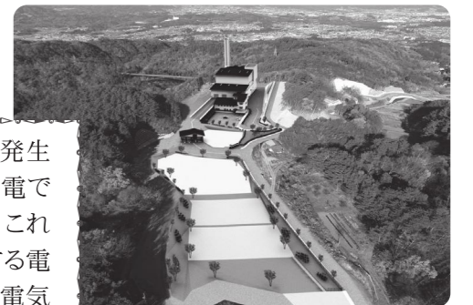
稲葉クリーンセンター完成イメージ

稲葉クリーンセンターは、ごみを燃やした時に発生する蒸気を使って発電(熱回収)をします。発電できる電力量は年間700万kWhの見込みで、これは一般家庭約2,100世帯が1年間に使用する電力量に相当します!発電した電気は焼却場の電気に使用し、残った電気は売却します。