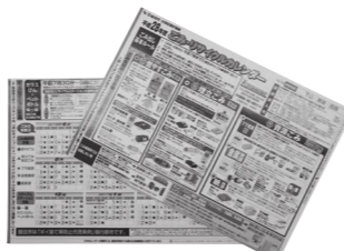
平成28年度リサイクルカレンダー

3月に配布するごみ・リサイクルカレンダー（4月～8月分）に情報を掲載しますのでご覧ください。また、7月から8月に配布するごみ・リサイクルカレンダー（9月～平成30年3月分）では、さらに詳しい分別内容、排出方法などをお知らせします。